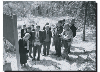
平成17年秋の研修会(武田信玄息女真理姫墓所)