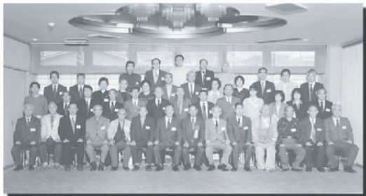
第2回通常総会(平成12年)