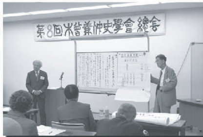
パネルディスカッション(平成18年第8回総会時)